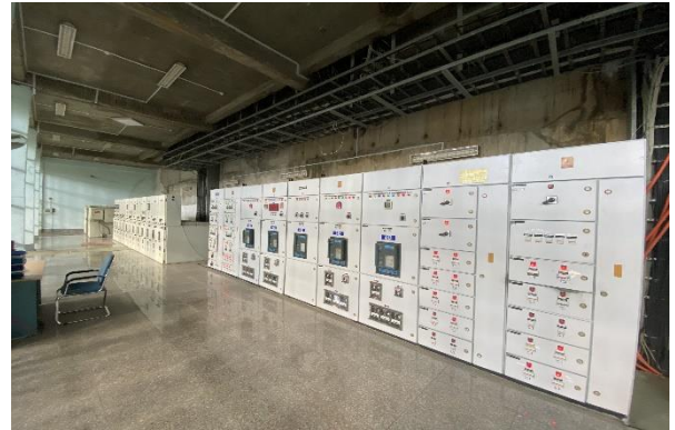
Phòng điều khiển