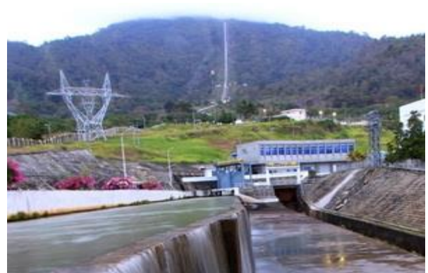
Sông Đăk Psi