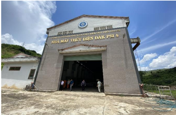
Nhà máy Thủy điện Đăk Psi 4