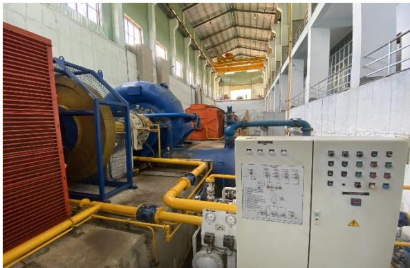
Tổ máy phát điện